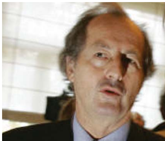
Jean-Marie Rouart , romancier (prix Interallié, prix Renaudot), membre de l'Académie française.

Pour ouvrir le champ de la réflexion, Jean-Marie Rouart, ni progressiste, ni réactionnaire, évoque le sujet de la langue qui, pour lui, nous façonne et nous unit, dans Adieu à la France qui s'en va , (2003).